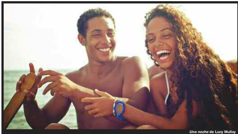
Una noche de Lucy Mulloy

Le festival grenoblois Vues d'en Face propose un large panorama de la production LGBT récente, où l'homophobie la plus violente côtoie des films plus légers sur le mode de la comédie musicale et de la romance adolescente.