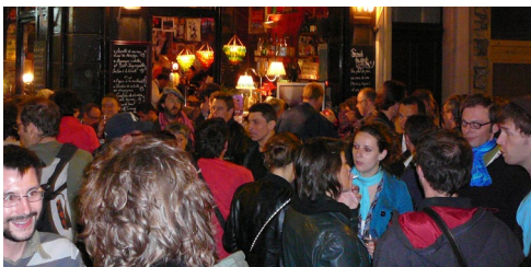
pot d'ouverture mardi 20 avril