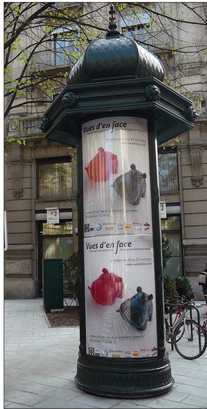
Affichage : 22 Colonnes Morris pendant 3 semaines