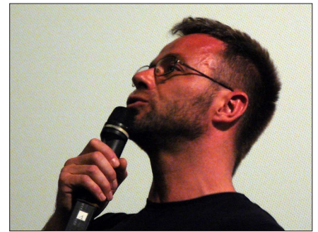
Louis DUPONT (Réalisateur de Bouche à bouche et Les garçons de la piscine)