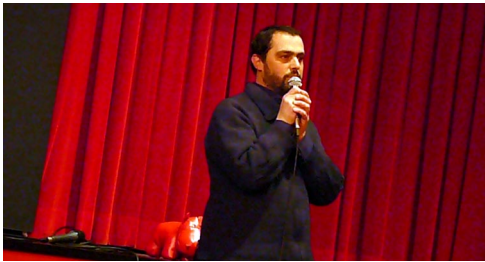
pré-ouverture à la cinémathèque