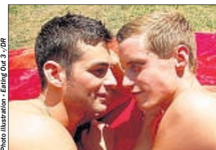
Photo illustration - Eating Out 3

Le festival international du film gay et lesbien « Vues d'en Face » commence mardi. On en profite pour découvrir le Grenoble de quand on aime une personne du même sexe. P.2