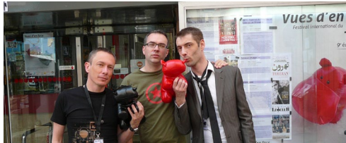
accueil du public au cinéma Le Club