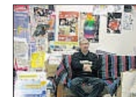
Le local d'accueil de la Cigale, 8 rue Sergent-Bobillot dans lequel les assos, comme ici A Jeu Egal, ont chacune une permanence hebdomadaire.

déos, laser games, jeux, auberges espagnoles attirent toutes les